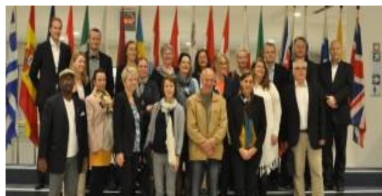
MPA-studiet på samling i Brussel.

I samarbeid med HiNT og HiST har Trøndelags Europakontor planlagt og gjennomført en samling i Brussel for MPA-studiet. Samlingen fant sted siste uka i mai 2015. I tillegg til en rekke forelesninger på Trøndelags Europakontor besøkte studentene EU-kommisjonen, Norges delegasjon til EU, Committee of the Regions, EU-parlamentet og EIPA i Maastricht.